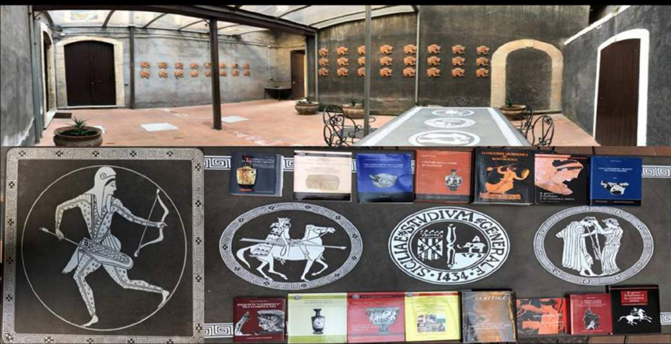
18. ARCHIVIO CERAMOGRAFICO