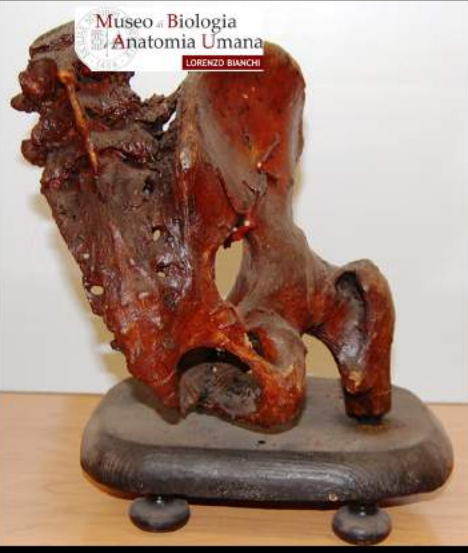
17. MUSEO DI BIOLOGIA E ANATOMIA UMANA "LORENZO BIANCHI"