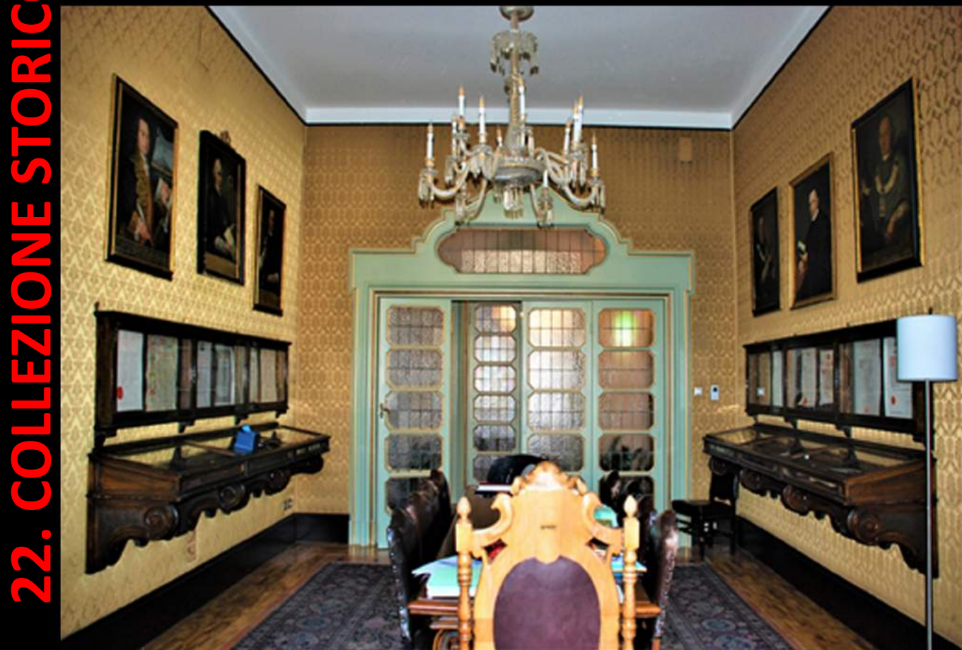
22. COLLEZIONE STORICO