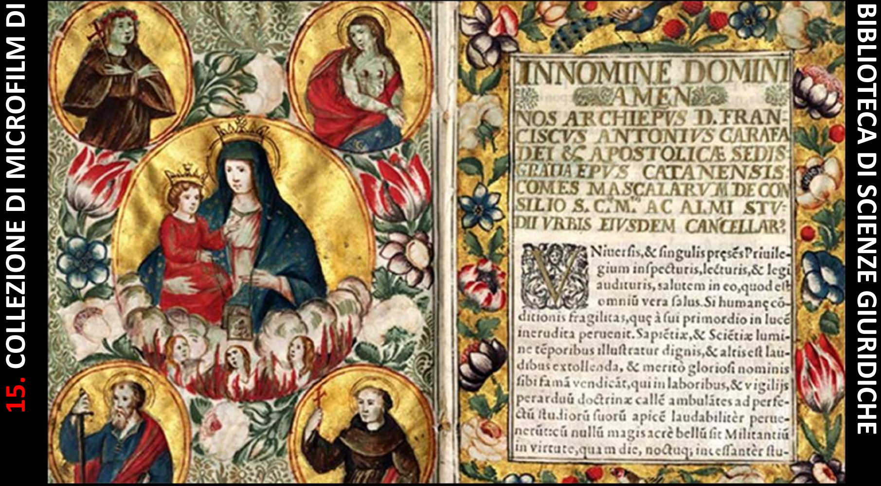
15. COLLEZIONE DI MICROFILM DI